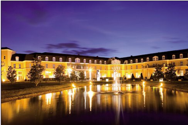
Dolce Chantilly, Hotels & Resorts.