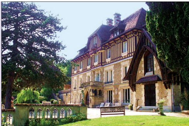
Au cœur de la forêt de Compiègne, à 1 heure de Paris, un lieu d'accueil unique et différent.