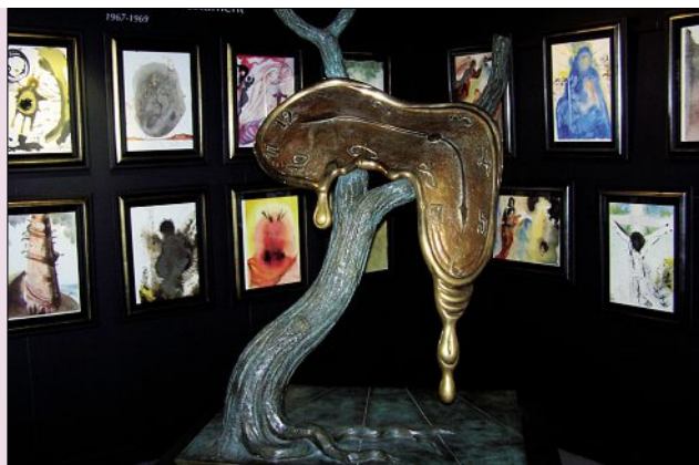
Créer votre événement dans l'univers surréaliste de Salvador Dalí.

11 rue Poulbot - 75018 - PARIS - Tél. 01 42 64 40 10 - Fax 01 42 64 93 17