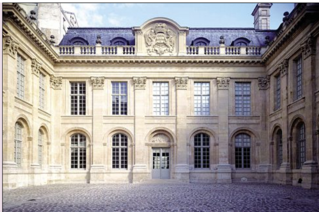
Cour d'honneur du Musée d'art et d'histoire du Judaïsme.

71 rue du Temple - 75003 - PARIS - Tél. 01 53 01 86 53 - Fax 01 53 01 86 63